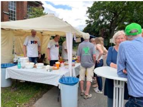
Überbackenen Camembert mit Preiselbeeren bei den Montagsmännern