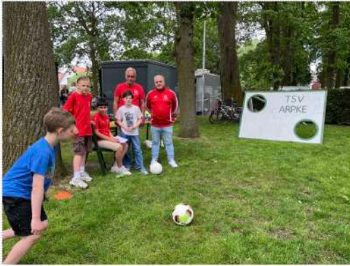
Die Jugendfußballer der JSG Leo beim Torwandschießen