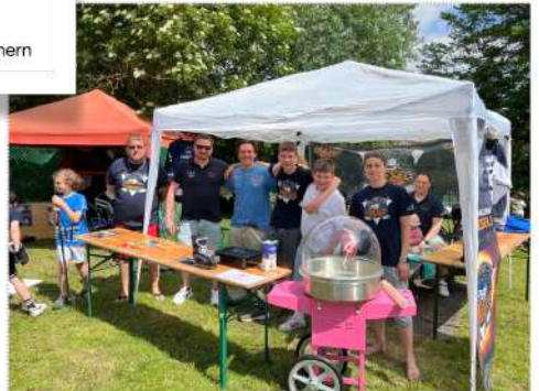
Die Inline-Skater der Arpker Wiesel beim Zielschießen