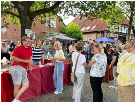
Die TSV Kapitänsbräute mit der leckeren Erdbeerbowle

Da wissen die Extremfederballer mit ihrer Bierspezialität und die dazugehörigen Seemannsbräute mit der leckeren Erdbeerbowle genau wie man/Frau da Abhilfe schafft.